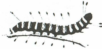
rups van Acronicta alni

H.Meijer vond op 15 juli de rups van Acronicta alni op Beuk ( Fagus ). Deze uil wordt pas sinds 1992 in Friesland waargenomen. In dat jaar werden drie vlinders gezien in Hemrik (S.Sinnema). In de afgelopen jaren wordt Acronicta alni in kleine aantallen als vlinder waargenomen. De rups leeft op verschillende loofbomen.